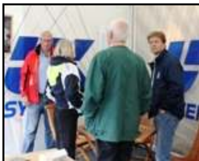
Syversens monter på Öppet varv

Öppet varv uppe på Orust drog sista helgen i augusti i vanlig ordning många besökare till sig. För att hinna med alla platserna under en helg krävs både bil, logistik, sköna skor och tålamod. Ju större båtar desto färre personer fick komma ombord samtidigt. Det fanns allt från en minifolkbåt till en riktigt stor katamaran med skinsoffa i vattnet. På land kunde man få goda idéer och köpa en och annan bra produkt inför nästa säsong.