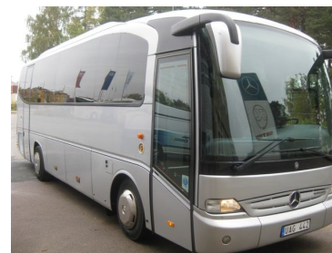
HSS egna buss

Denna grupp brukar åka på Vansbrosimmet tillsammans.