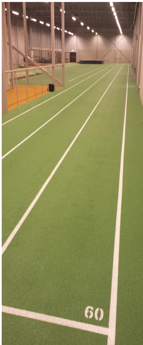
Angeredshallen, mars 2014

Redaktörer: Curt-Roland Ljung, Roger Andersson